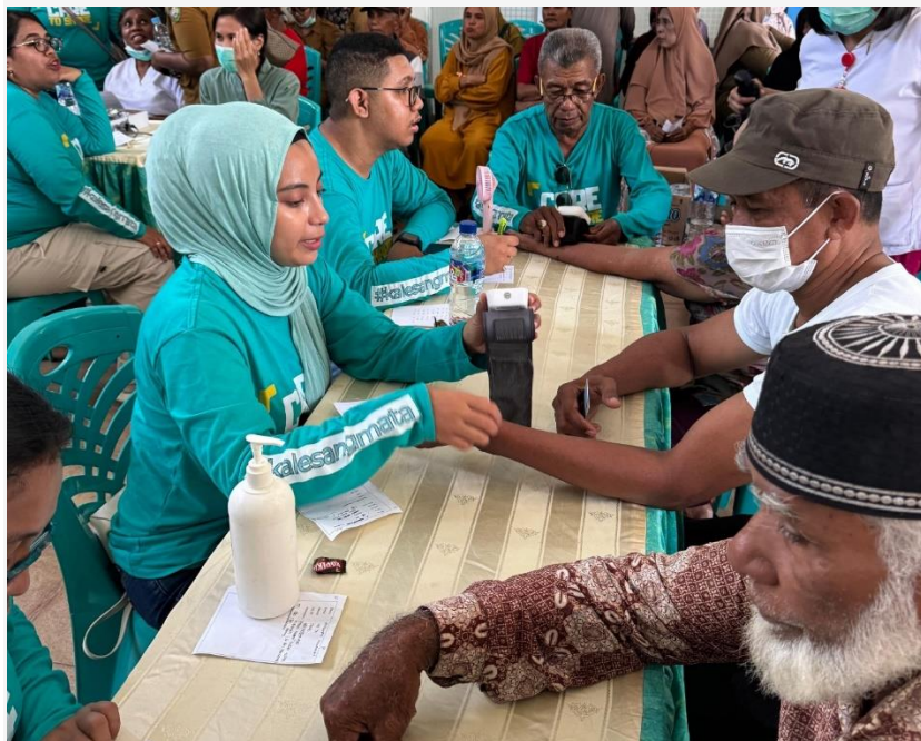
Medewerkers van de oogkliniek in Kei ( rri.co.id/ambon 12 nov. 2024).