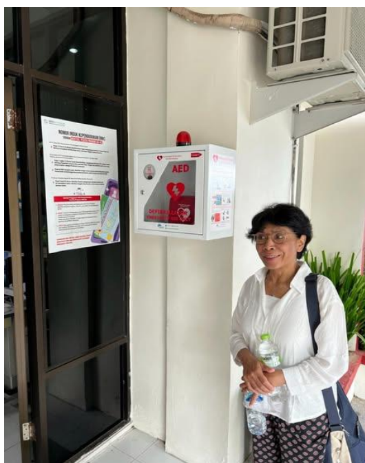
SSVA heeft alle puskesmas in Ambon een AED apparaat geschonken.