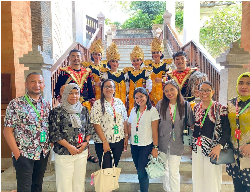
Medewerkers van de oogkliniek 'Ambon-Vlissingen' nemen deel aan het Internationaal Congras van de Asian-Pacific Academy of Otmologie, februari 2024.