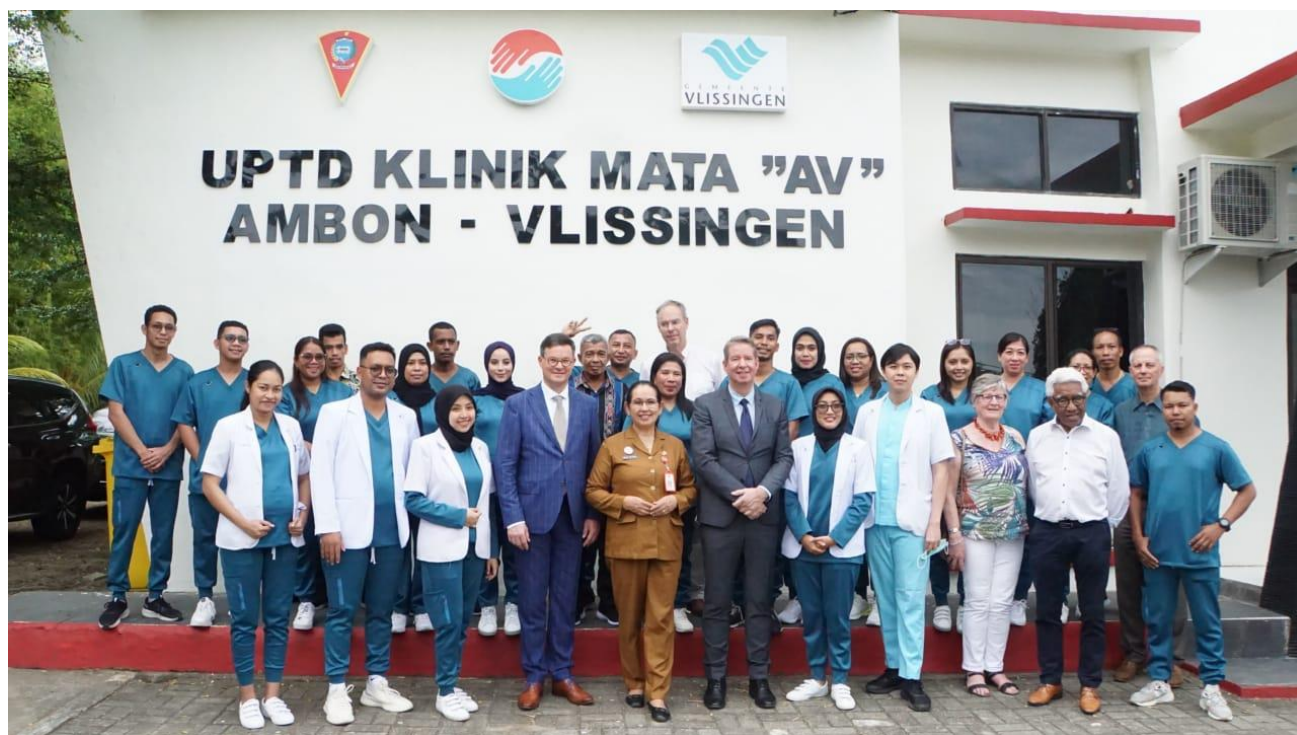
Ontwikkelingswerk, vertrekkend op lokaal niveau.

De titel van de lezing is : “ontwikkelingssamenwerking in deze tijd, vertrekkend op lokaal niveau”. De huidige samenleving telt vele nationaliteiten. Als een bevolkingsgroep in het Westen haar thuisland, stad of dorp wil ondersteunen, is het raadzaam op lokaal niveau te werken. Laat de mensen uit je eigen regio het werk doen, samen met mensen uit de ontvangende regio. Met resultaten als persoonlijke ervaringen van mensen uit de eigen regio en draagvlak. Eigenaarschap zal leiden tot concrete resultaten.