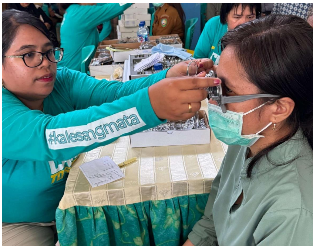
Medewerkers van de oogkliniek Ambon-Vlissingen actief in Maluku Tenggara, november 2024.