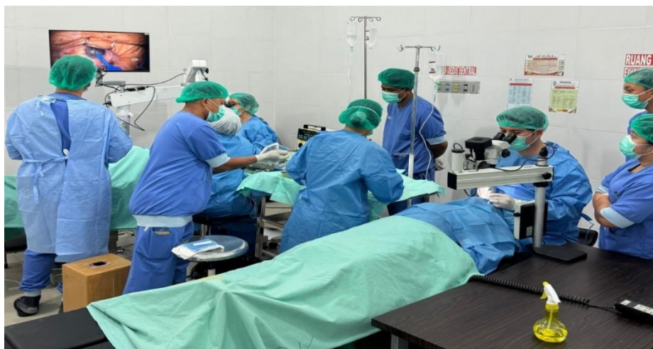
Medewerkers van oogkliniek "Ambon-Vlissingen" actief in Kei.