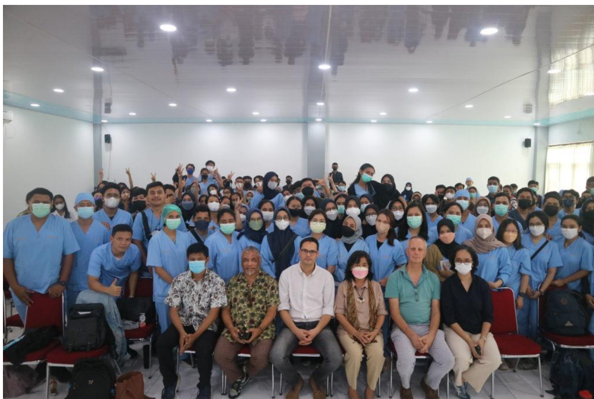
Samenwerking Universitas Pattimura – SSVA.